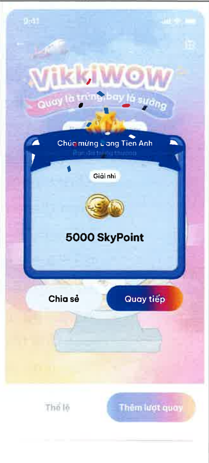
Màn hình trúng thưởng