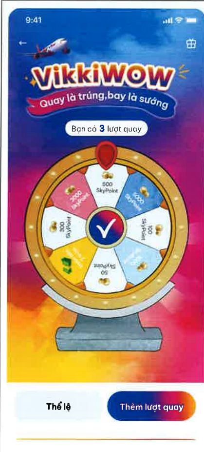
Màn hình trúng thưởng