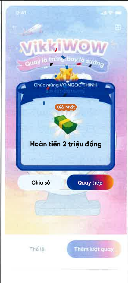
Màn hình trúng thưởng